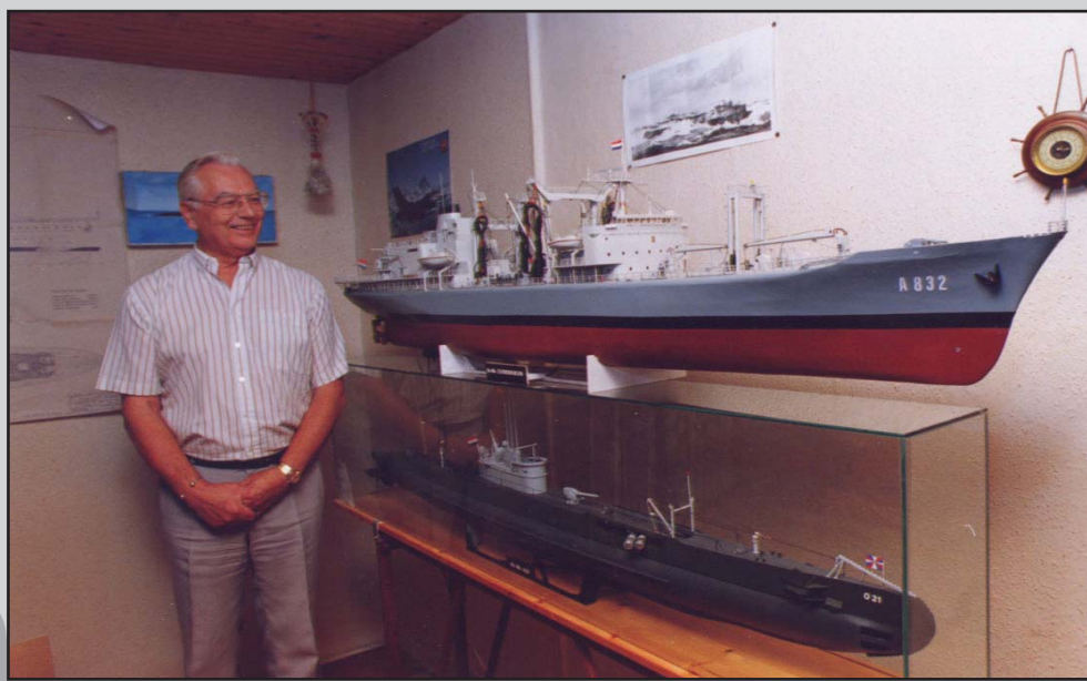
Trots kijkt van Asten naar twee van zijn modellen: Hr. Ms. Zuiderkruis en onderzeeboot O 21.